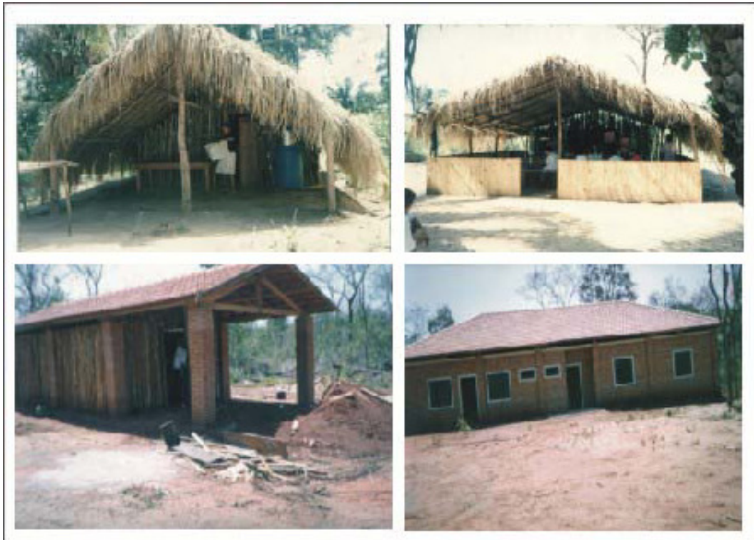
Figura 2: Comparação das casas indígenas Ofaié.

1ª reserva: casas de madeira e palha (1995)